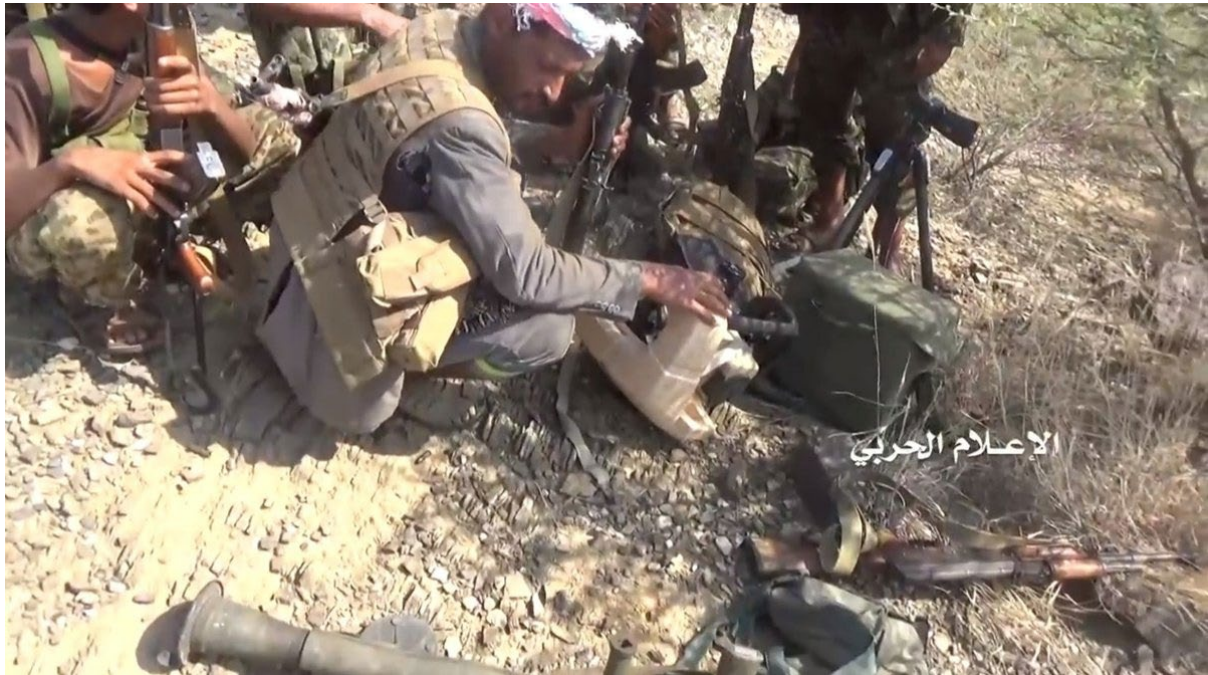
<예멘 후티 반군에 노획된 현궁>

한국이 인도네시아에 수출한 총기, 장갑차, 곡사포 등은 웨스트파푸아 지역의 분리독립 운동을 폭력적으로 탄압하는 데 쓰이고 있다. 한국산 수류탄과 대전차무기 현궁이 2018년 예멘 내전에서 사우디 연합군에 의해 사용됐다. 사우디로부터 현궁을 노획한 후티 반군은 이를 SNS에 자랑했다. 후티 반군 또한 이렇게 빼앗은 무기를 사용했을 것이라 추정된다. 2019년 튀르키예의 시리아 쿠르드족 공격에도 한국산 포탄이 사용됐다.