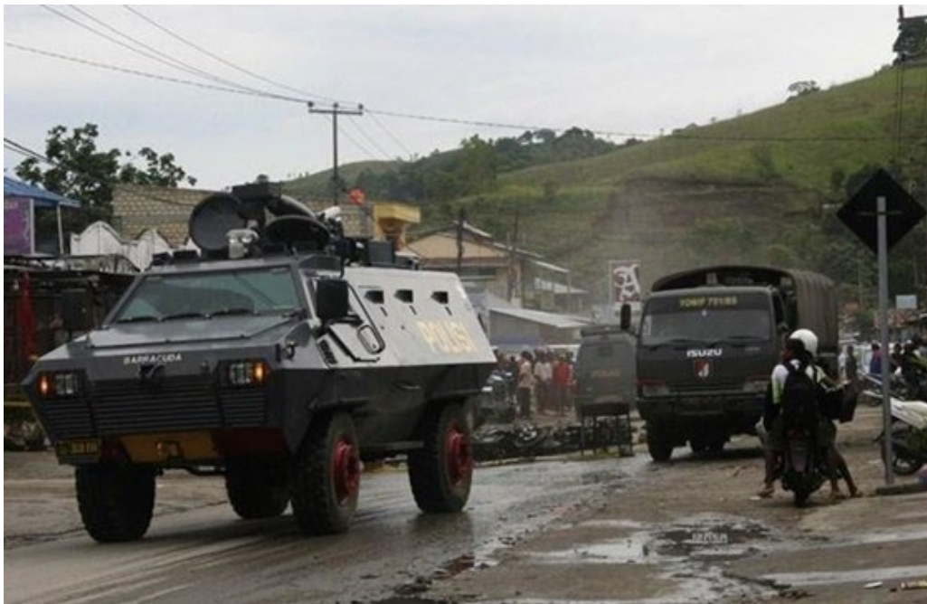
<웨스트파푸아의 거리를 활보하는 한화의 바라쿠다 장갑차>

무기 산업의 근본적인 문제는 누군가의 죽음과 고통에 의존한다는 것이다. 전쟁이 무기 산업을 촉진하는 것처럼 무기 산업 역시 전쟁을 촉진한다. 무기 산업이 전쟁과 무력 분쟁의 유일한 원인은 아니지만, 이미 갈등이 존재하는 상황에서 무기 거래는 무력 분쟁의 발발 가능성을 현저히 높인다는 실증적 근거가 있다.