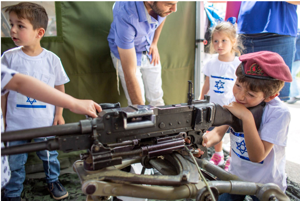
<학교로 찾아 온 무기체험>

수감생활 이후, 이스라엘에서 도망치고 싶은 마음에 그리스에 가서 잠시 살았는데 외국에서 사는 이스라엘 사람들도 어김없이 군대에서 무엇을 했는지를 물었습니다. “군대에서 뭘 했는가?”는 지금도 타인에게 기본적으로 묻는 질문입니다. 이스라엘의 페미니즘은 평등을 위해 여성도 남성처럼 군대에 가라고, 더 발전하기를 바란다면 전투부대에 복무하라고 얘기합니다. 성별, 종교, 군복무 여부 때문에 차별받지 않는다고 법에 명시되어 있지만 군에 가지 않은 사람에 대한 차별은 여전히 있습니다.