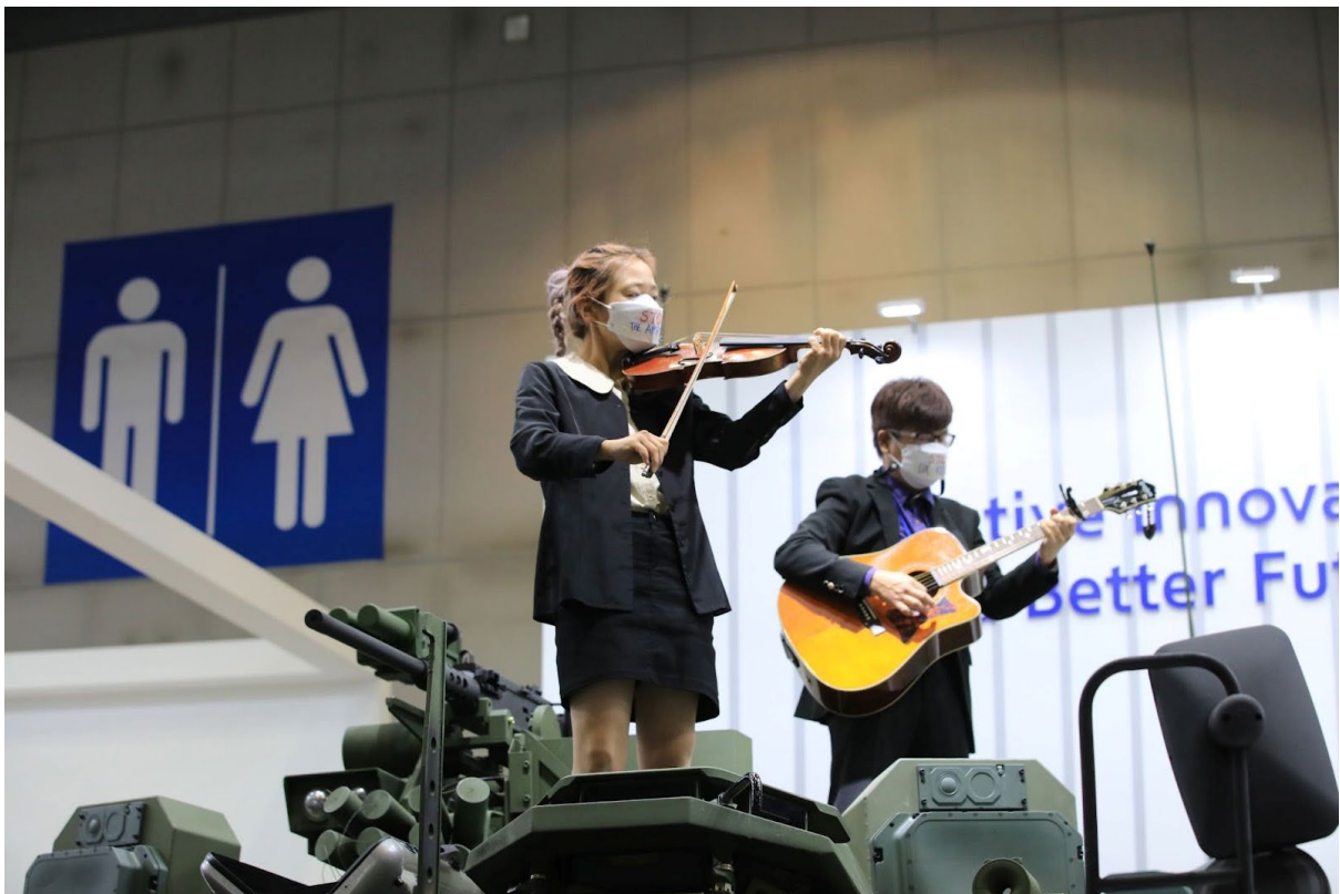
<DX KOREA 2022 방해 시위>

구매자도 문제다. 무기박람회에는 각국 군대의 무기 획득 권한을 가지고 있는 국방부장관 및 군 수뇌부, 방위사업청장급 인사들이 ‘VIP’로 참여한다. 작년 DX KOREA에는 37개 대표단이 ‘VIP’로 초청됐다. 이중 14개 대표단이 전쟁이나 무력 분쟁에 직접 관련된 국가이고, 9개는 우크라이나 무기 지원 국가이다.